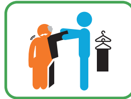
ஆடை உடுத்திக் கொள்வதற்கு