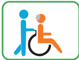
Walking or moving around