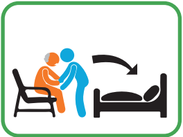
இடம் விட்டு இடம் மாறுவதற்கு